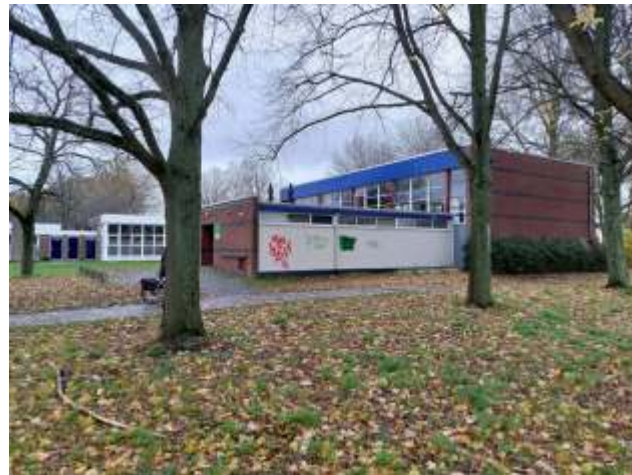
Eén van de gekozen locaties: de gymzaal aan de Canadalaan

Zie voor verdere informatie: www.stemvan.groningen.nl/budgets/24 . Via deze site is het project online op de voet te volgen!