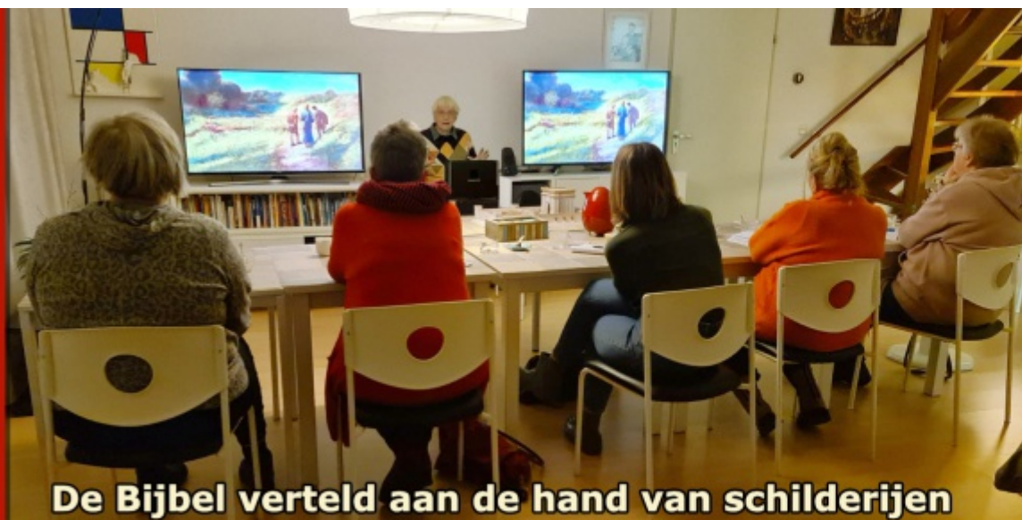
De Bijbel verteld aan de hand van schilderijen

Dan is 'Bijbel uit de doeken' echt iets voor jou, want deze cursus is multimediaal en afwisselend. Je raakt in korte tijd op een leuke manier wegwijs in de essentie van de Bijbel.