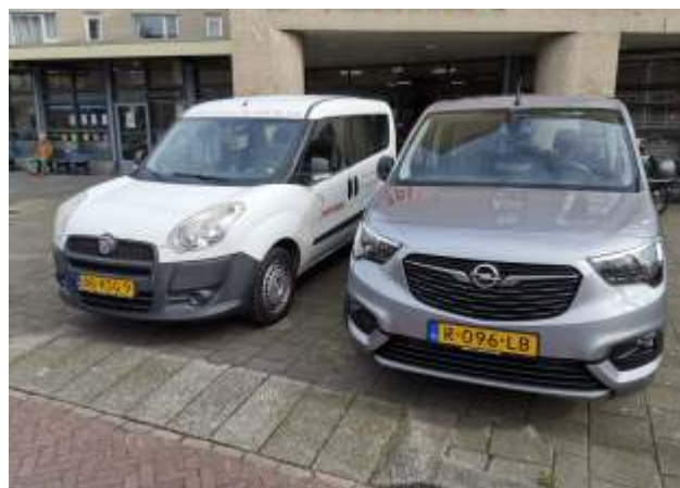
De oude en de nieuwe Buurtvlinder even naast elkaar

Wanneer deze Zuidwester bij de lezers in de bus komt, zal de nieuwe Buurtvlinder ongetwijfeld al in gebruik zijn genomen. De chauffeurs hebben een weekend 'geoeffend' met het rijden in de nieuwe auto, vooral ook omdat het een automaat is. Is even wennen wanneer je daar normaal gesproken niet in rijdt. Op de foto hiernaast heeft de nieuwe auto nog